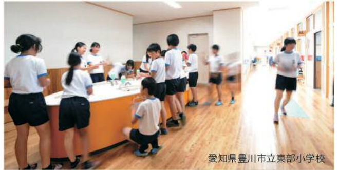
愛知県豊川市立東部小学校