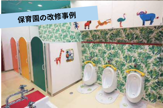
保育園の改修事例