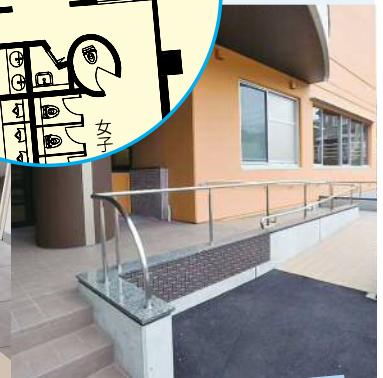
長寿命化への期待は 「コスト削減」