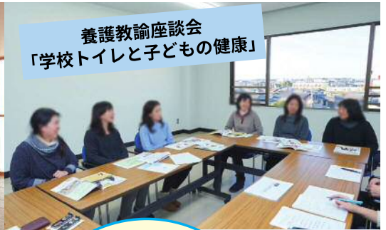
養護教諭座談会 「学校トイレと子どもの健康」