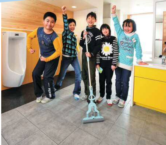
学校トイレの挑戦！ 小中学校事例と自治体取り組み