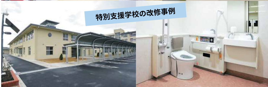
特別支援学校の改修事例