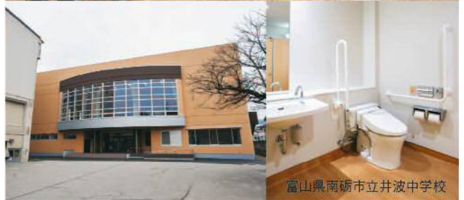
富山県南砺市立井波中学校