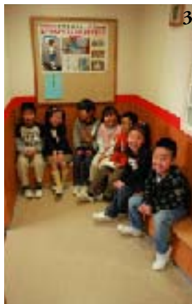
3. つめれば10人は座れる大きなベンチが入り口付近に2カ所も設置されている。 4.5. ワークショップの最後に全員が描いた「サイン」。思い思いのアイデアが「自分たちのトイレ」という意識を強くする。 6. 学校のトイレはどこも同じような色使いでつまらない、という意見が多かったという。そのせいか、洗面台は各トイレごとに異なった明るい色使いが。