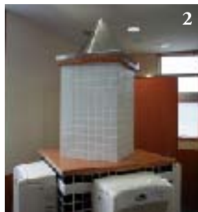
1. 去年参加した3年生の多くが4年生になった今年、2回目のワークショップにも参加した。 2. 男子トイレの中心にすえられた尖塔は映画「ハリー・ポッター」に登場する校舎をイメージしている。