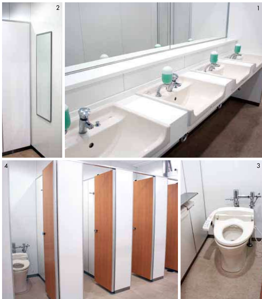
1. 幅広いボウルでしっかり洗え、水はねも少ない洗面器を採用。スポーツ後の洗顔にも便利。 2. 入り口付近に設置された窓。改修後に行った生徒向けアンケートで「用足し以外のトイレでの行動」をたずねると、64%の生徒が「身だしなみ」と回答。3. ウォシュレット、音姫付きの洋式便器。棚付きの二連紙巻器はポーチ等が置いて便利。4. 改修前には2つしかなかった洋式便器がなんと7つに。