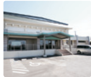
屋根はALC板から鉾板に葺き替えた。