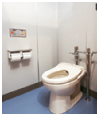
快適性のため温水洗浄便座を採用。操作性のよいリモコンを設置。