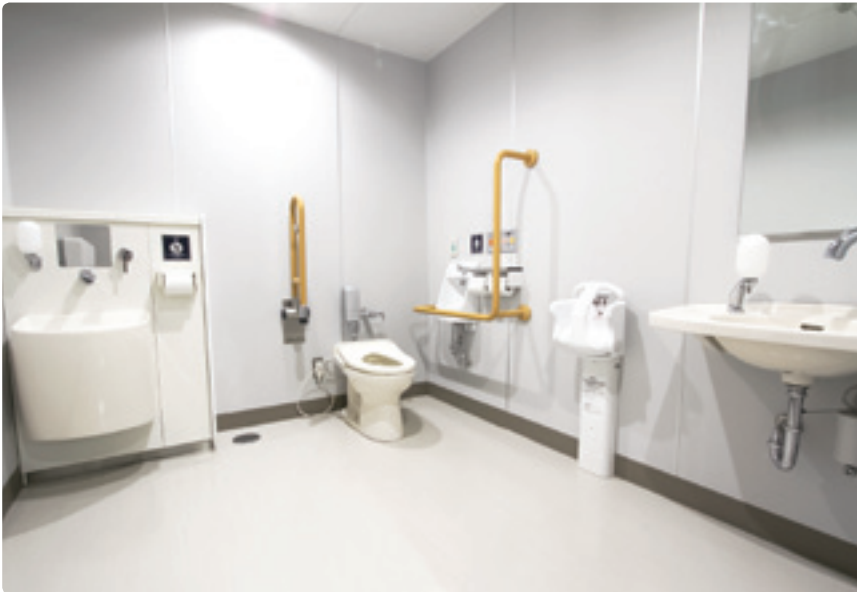
「埼玉県福祉のまちづくり条例」では、学校などの生活関連施設にオストメイト用設備を設けるなど、トイレの整備基準が定められている。松伏中学校もこの基準をクリアしている。