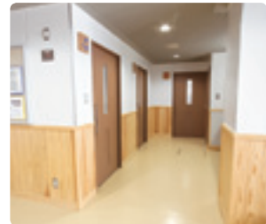
腰の位置まで県産の杉材を使用したトイレ前。