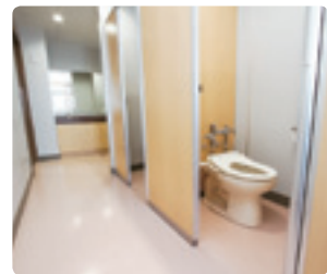
廊下からトイレ内までフラット。乾式の床で掃除をしやすく清潔に。