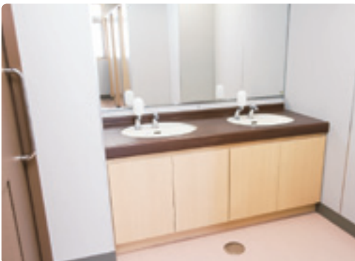
不特定多数の人が使うため、洗面台は自動水栓で衛生面に配慮。ブラウンの天板が木質の空間に調和。