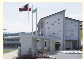
スクールバスで通う生徒が多いので、玄関にはバス乗り場が。

朝食を安心して食べてもらえるよう 最高のトイレ作りに挑む かつては朝食を抜いていた生徒たち。理由は学校のトイレに入りたくないから。子どもたちの食習慣を守りたいと、トイレにこだわった学校が完成しました。