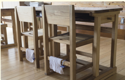
施設設備を大切にしようと、各生徒が一枚ずつ自分の雑巾を持参。トイレ清掃への意識も高い。