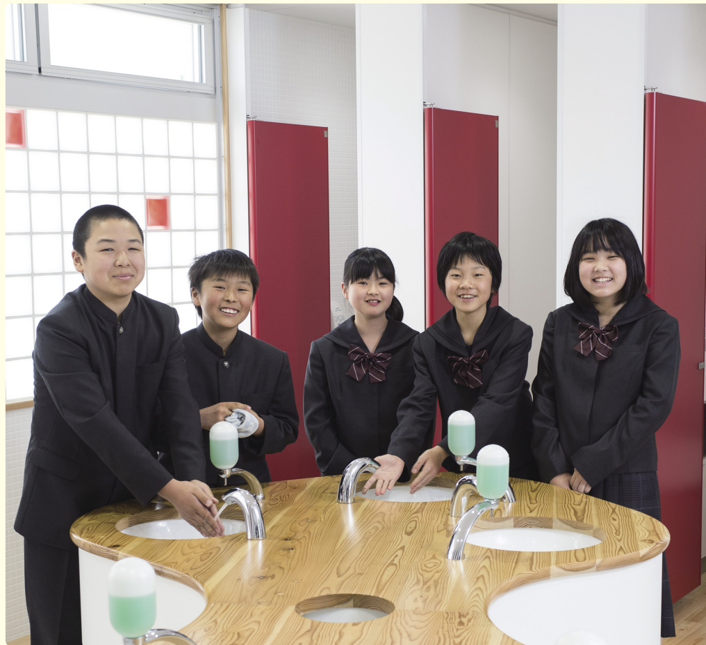
女子トイレは扉が赤。「色は違うけれど男子トイレと同じだね」と男子生徒。洗面台は自動水栓で節水と感染予防対策。