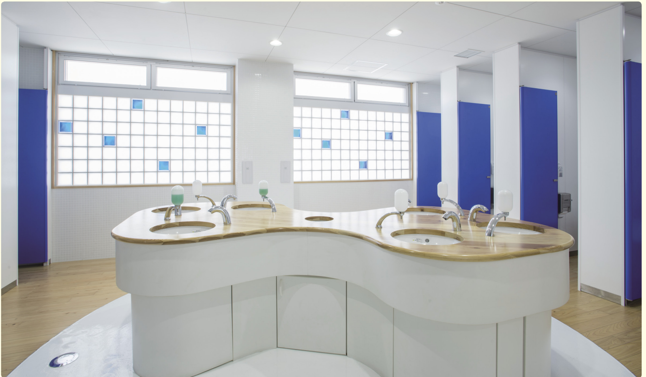
トイレは南側に設置。ガラスブロックを設え、明るさを確保するとともに意匠にも配慮。上部は換気ができるよう窓をつけている。男子トイレもすべて洋式便器の個室に。