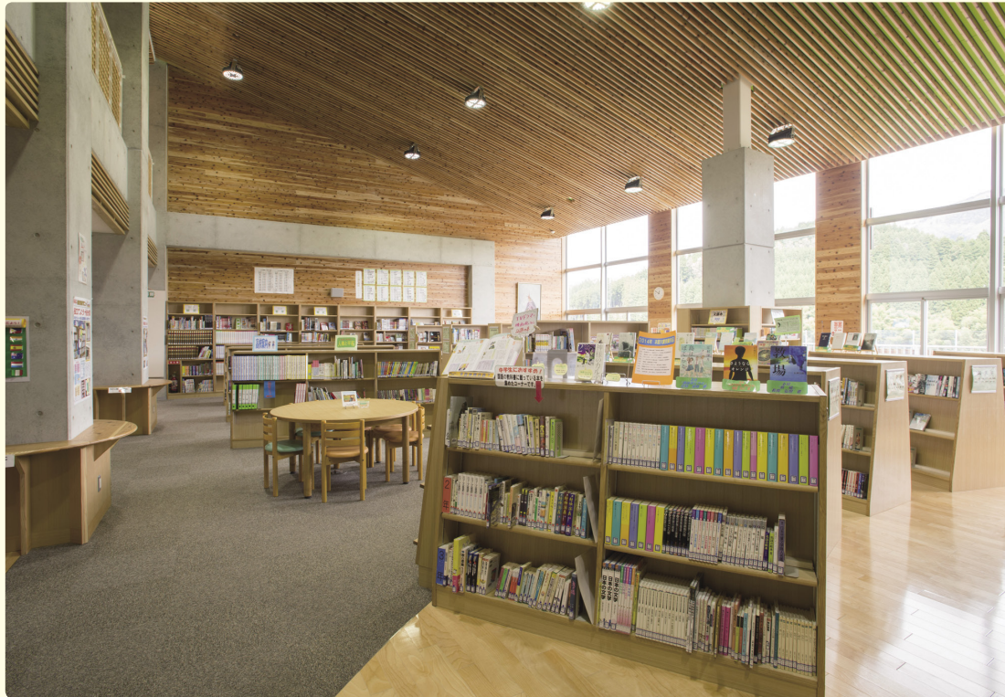
誰もが短い休み時間にもすぐに本が読めるように、校舎の真ん中に開放感のある図書館を置いた。