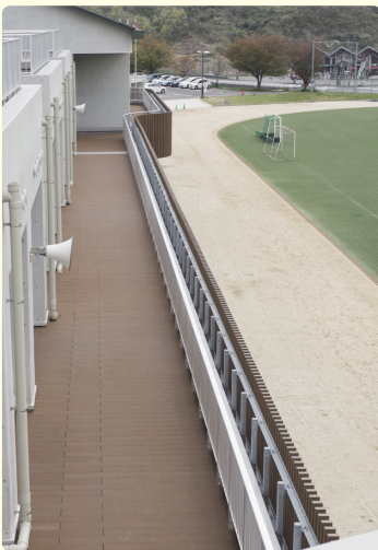
2階のテラスは全長140m。広い運動場のギャラリー席にもなる。