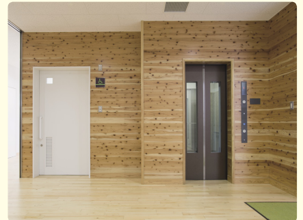
エレベーターと多機能トイレを並列し、使い勝手に配慮。