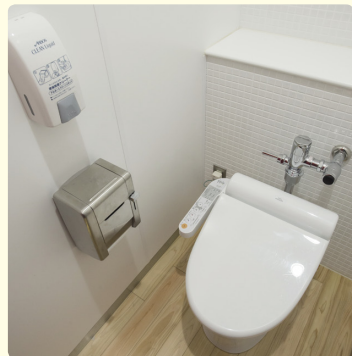
冬は寒いので、便座は暖房付き。家庭のトイレに合わせて、半分は温水洗浄便座に。