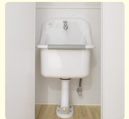
トイレ掃除に使った雑巾は、道具入れ内の掃除用流しで洗うよう指導。