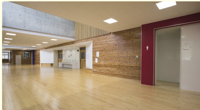
広々としたトイレ前の空間。床はほとんどがヒノキ。壁もヒノキやスギを多用し、ぬくもりがある。倉庫をはさんで、向こう側が男子トイレ。

朝食を安心して食べてもらえるよう 最高のトイレ作りに挑む かつては朝食を抜いていた生徒たち。理由は学校のトイレに入りたくないから。子どもたちの食習慣を守りたいと、トイレにこだわった学校が完成しました。