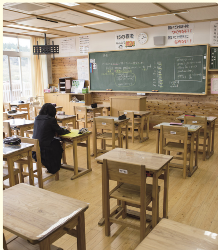
教室の机や椅子もスギ材で製作。ぬくもりある環境の中、勉強ができる。