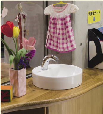
きれいな手で本を読んでほしいと、図書館の片隅には洗面台を設置。