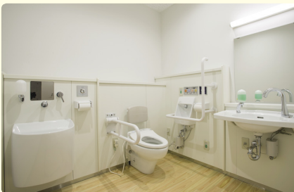
多機能トイレは、すべてオストメイト付き。現状は、学校公開時に高齢者などが利用。