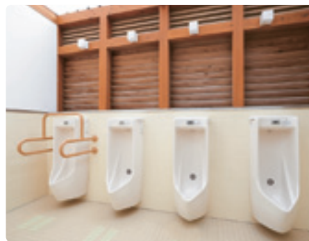
小便器に的のマークのついた男子トイレ。明るだけでなく、ルーバーの快適な風通しで、全く臭いを感じさせない。