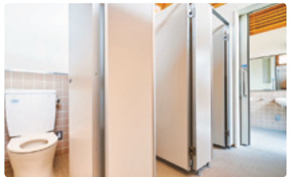
女子トイレ。擬音装置は全ブース標準仕様となっている。