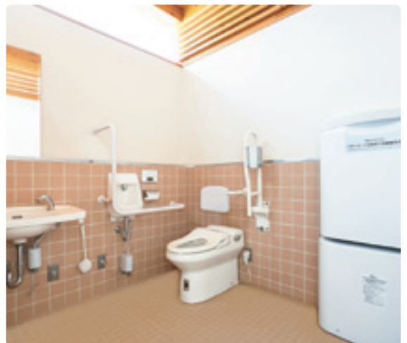
多機能トイレにはベビーシートも完備。自動水栓の手洗いは2台設置。

南面(図の下)は石鎚山の吹き下ろしがあるため、壁の開口部は上部のみ。洗面とトイレスペースの間には引き戸が入っている。