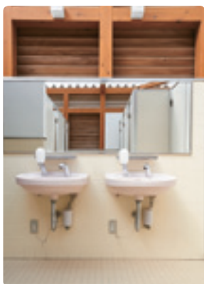
手洗いはすべて自動水栓で、ボウルのカラーは男女で変えている。目の高さには広めの鏡が。