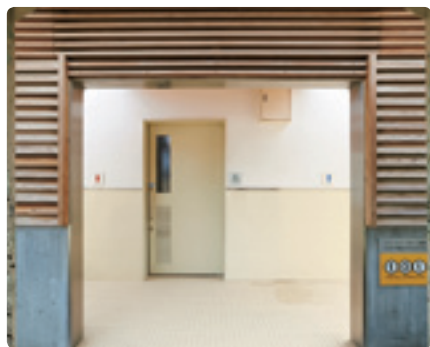
通路正面は多機能トイレ。入口にはスポーツ振興くじ助成金の印も。

入口は左右いっばいにグレーチング(側溝のふた)が施され、水が流せるようになっている。