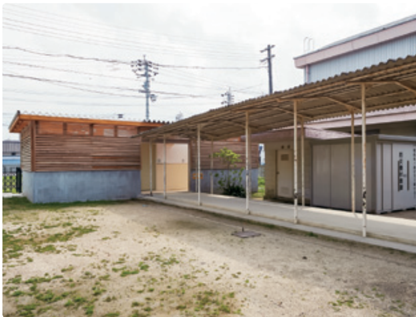
写真右側が体育館。グラウンドからは屋外トイレに上がる通路左側でスリッパを履き替えるようになっている。