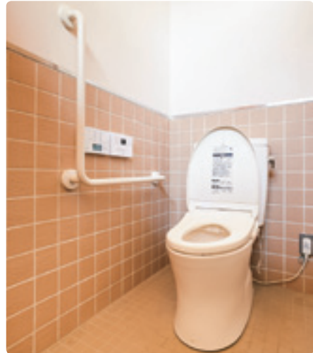
女子トイレは1ブースのみ、簡単な介助ができるスペースが確保され、きれい除菌水で便器のボウル面を洗う温水洗浄便座を導入。