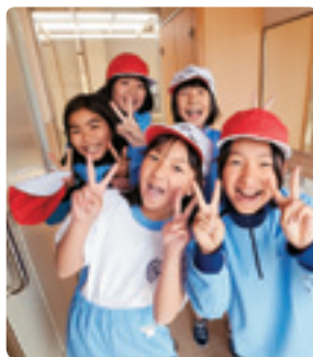
屋外トイレは体育館から出てきた女の子たちにも好評。

体育館からはスリッパに履き替え、校庭からは土足のまま入る。両方からのアプローチが可能な床仕様。