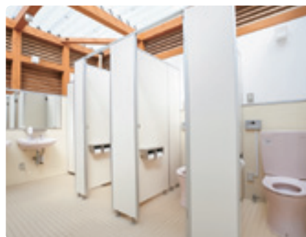
天井はポリカーボネート板を使用。十分な採光のため、日中は照明も不要。