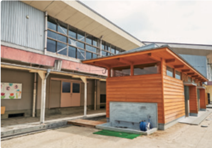
西側から見た屋外トイレ。奥には2つの体育館、右側には広い校庭が広がる。PTA対抗の球技大会などの時期は毎日のように屋外トイレが大活躍しているという。