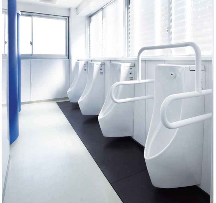
1階の窓は上層階から見えてしまうため、採光と目隠しを兼ね備えたルーバーを設置。