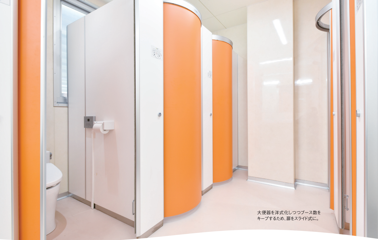
大便器を洋式化しつつブース数をキープするため、扉をスライド式に。