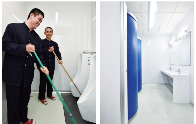
小便器は清掃しやすい壁掛け式。