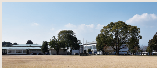
普通教室棟2Fトイレ