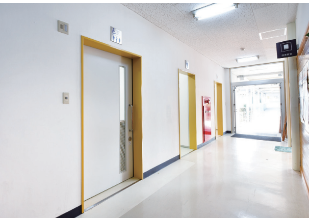
特別教室棟の1階は教室移動で利用しやすい場所にある。女子トイレと男子トイレと並列して、多機能トイレを設置。