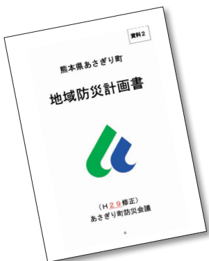
ブラッシュアップされたあさぎり町の「地域防災計画書」。

トイレの改修に当たって、町の教育委員会では、児童や生徒にトイレに関するアンケートを実施。その結果を踏まえて議論し、町内