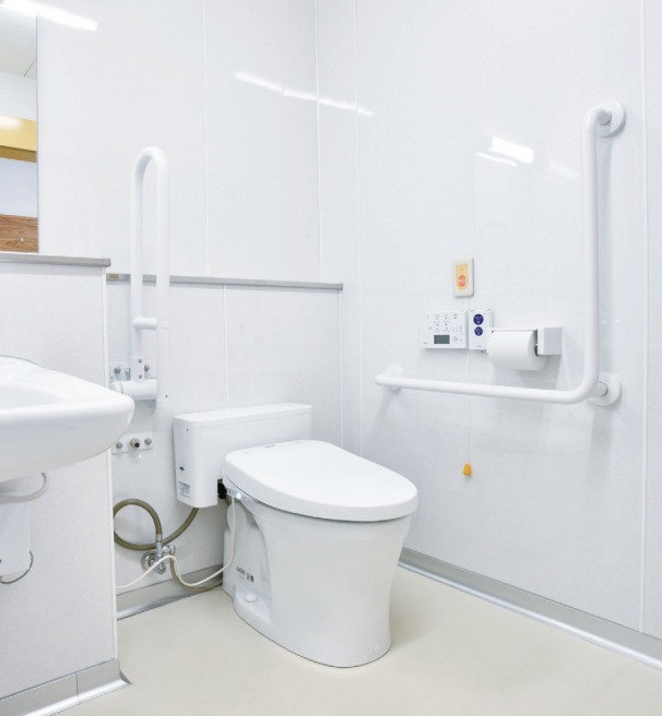
使いやすく配慮された多機能トイレ。