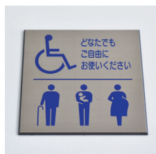
多機能トイレには要配慮者だけでなく誰でも使えるように、コメントも追加。

「多機能トイレには要配慮者だけでなく誰でも使えるように、コメントも追加。」 「多機能トイレには要配慮者だけでなく誰でも使えるように、コメントも追加。」 「多機能トイレには要配慮者だけでなく誰でも使えるように、コメントも追加。」