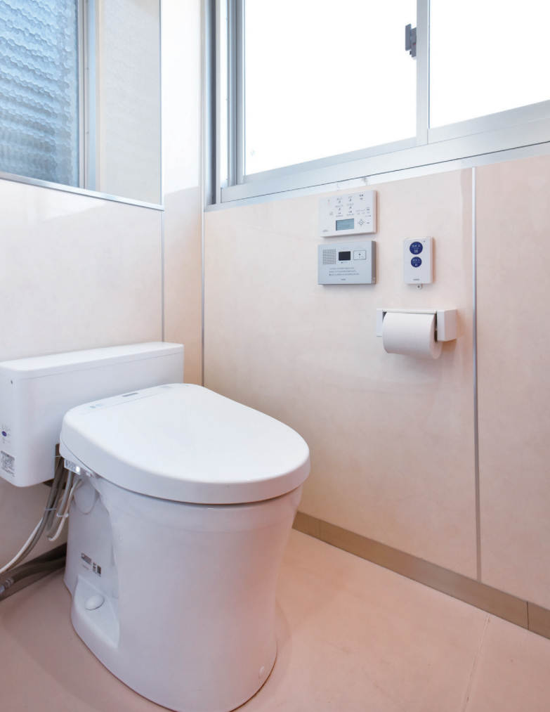
混雑に対応するため、便器は連続洗浄が可能なフラッシュタンク式を採用。女子トイレには温水洗浄便座、さらに節水に配慮して擬音装置を設置。