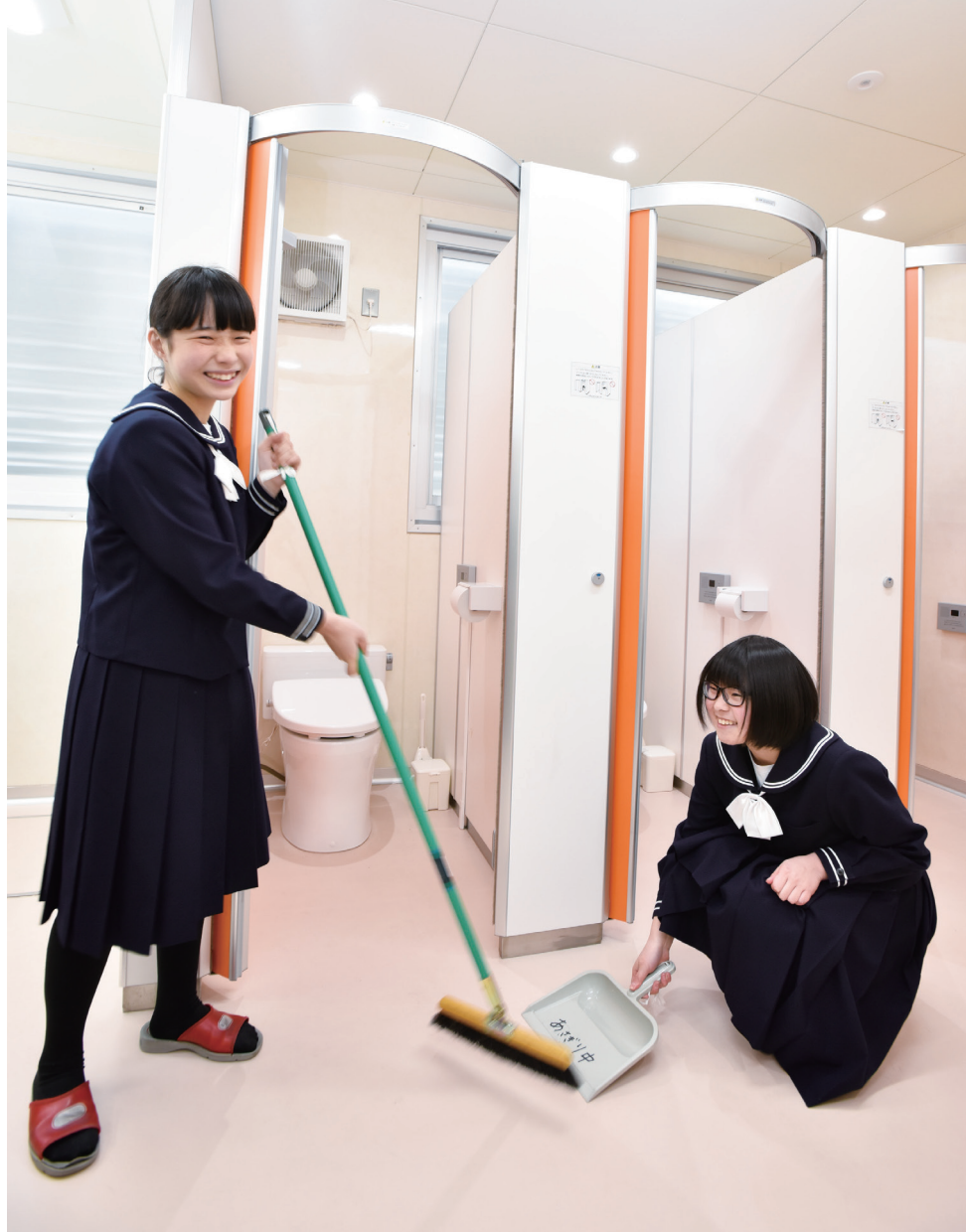
照明はLEDライト自動点灯。きれいで明るいトイレで掃除をする生徒たちの顔には笑顔があふれて。